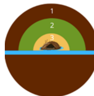
Figuur 1. Verschillende werkzone's in bevergebied.

Optie 2: Als werkzaamheden vanwege dwingende redenen binnen de kwetsbare periode en binnen 20 meter moeten plaatsvinden, moet dit worden afgestemd met de ecologisch deskundige.