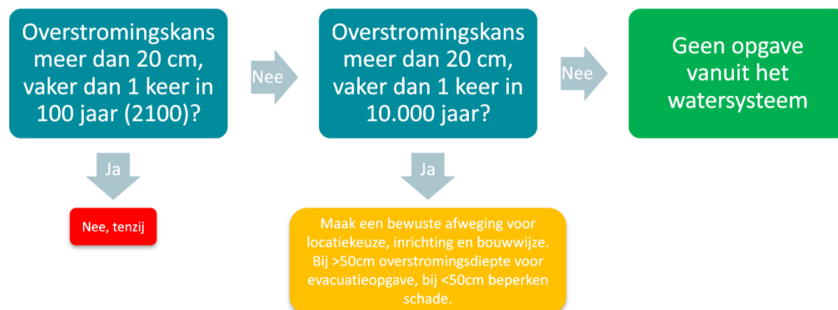
Figuur 3. Het concept ruimtelijk afwegingskader klimaatadaptieve gebouwde omgeving vanuit het Rijk, voor het onderdeel watersysteem.